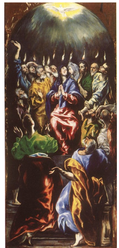
La Pentecôte, Le Greco, 1600